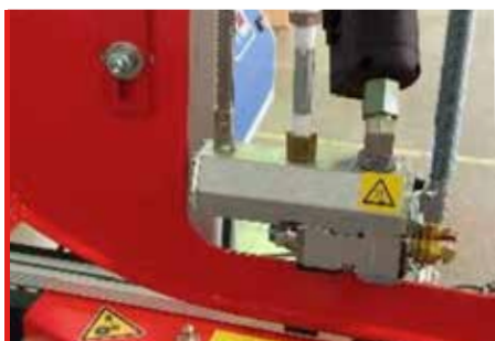
Cierre con Hot Melt (OPCIÓN)